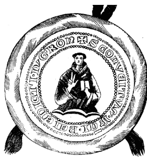
Obr. 9 Rekonštrukcia druhého typu pečate hronskobeňadického konventu (14. stor.)

JERNEY, A magyarországi káptalanok, obr. 87.