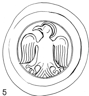
Obr. 5 Rekonštrukcia pečatného obrazu v prvom type pečate jágerskej kapituly (12. - 13. stor.)

V pečatnom poli dominuje jeden z najznámejších symbolov sv. Jána Evanjelistu v podobe orla so svätožiarou okolo hlavy. Kresba: Miriam Glejteková, podľa MNL OL DL 83127.