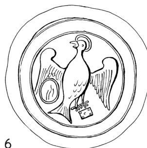
Obr. 6 Rekonštrukcia pečatného obrazu v druhom type pečate jágerskej kapituly (13. stor.)

V pečatnom poli dominuje jeden z najznámejších symbolov sv. Jána Evanjelistu v podobe orla so svätožiarou okolo hlavy. Kresba: Miriam Glejteková, podľa MNL OL DL 83127.