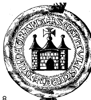
Obr. 8 Rekonštrukcia prvého typu pečate hronskobeňadického konventu (13. stor.)

Ukážkou obdivuhodnej kontinuity pečatného obrazu je aj posledné stredoveké pečatidlo jágerskej kapituly. V tomto prípade orla dopĺňa stuha s menom apoštola. Kresba: Miriam Glejteková, podľa MNL OL DL 68792.