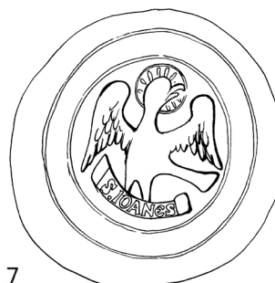
Obr. 7 Rekonštrukcia pečatného obrazu v tretom type pečate jágerskej kapituly (13. stor.)

Orol sa dostal aj do druhého typu kapitulskej pečate jágerskej kapituly. Zmena nastala len v štylizácii a rozmeroch pečatidla. Kresba: Miriam Glejteková, podľa MNL OL DL 451.