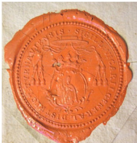
Obr. 41 Pečať vikára Trnavského dištriktu z roku 1838 [ŠA Nitra]

daný najmä rannonovoveký materiál. To bude úlohou ďalšieho výskumu. 207