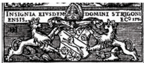
Obr. 37 Pečať Mateja Gréciho z roku 1560 [ŠA Levoča]; Obr. 38 Erb Mikuláša Oláha [Péterffy 1742]

ktorý drží privrátenú berlu zvisle v ľavej ruke (obr. 40). 204 Zaujímavou reminiscenciou na stredoveké špicato-oválne pečate predstavuje pečať vikára z roku 1891. Táto rovnako zobrazuje známy erb so sv. Vojtechom. Tvar pečate však nie je okrúhly, ale špicato-oválny. 205