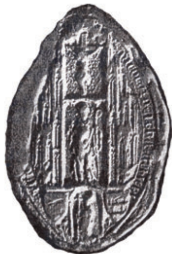
Obr. 32 Pečať Mikuláša Kesziho [Bodor 1983]