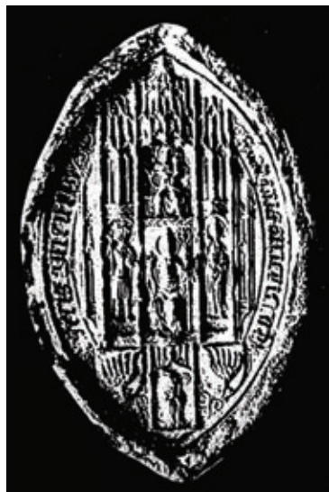
Obr. 29 Pečať arcibiskupa Boleslava [Bodor 1983]; Obr. 30 Pečať arcibiskupa Jána Kanižaia [Bodor 1983]

vzor i pre pečate prelátov v strednej Európe. 181