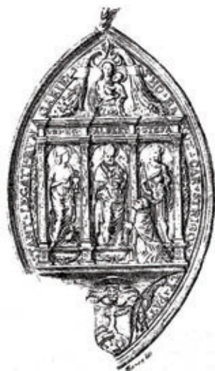
Obr. 31 II. typ pečate Tomáša Bakóca [Nyáry 1886]

K pečatiam stredovekých ostrihomských arcibiskupov možno pri troche zhovievavosti priradiť aj pečať ostrihomského arcibiskupského vikára Jána z roku 1365 (obr. 33). 191 Táto pečať okrúhleho tvaru zobrazuje v bohatom architektonickom rámci postavu biskupa (?) s mitrou na hlave. Táto postava nebola doposiaľ identifikovaná. Nedá sa vylúčiť, že tiež ide o postavu sv. Vojtecha. Podporovali by to i zvyklosti susedných diecéz. Napríklad pečate jágerských biskupských vikárov z polovice 14. storočia sú tvorené jednotnou schémou. Vždy ide o okrúhle typárium vyplnené orlom, symbolom sv. Jána, evanjelistu, patróna