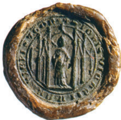
Obr. 33 Pečať vikára Jána [Hegedűs 2000]