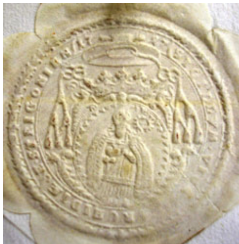
Obr. 39 Pečať ostrihomskeho vikára z roku 1768

Zo sfragistického materiálu, ktorý máme k dispozícii, vyplýva, že svätý Vojtech tvorí významný prvok cirkevných pečatí na území Ostrihomskej arcidiecézy. Uplatnenie našiel v pečatiach takmer všetkých stupňov cirkevnej správy od pečate kapituly, cez pečate nižších správnych celkov arcidiecézy až po arcibiskupov a nižších hodnostárov. Pri absencii pečate arcidiecézy stáva sa diecézny patrón dôležitou súčasťou pečatí samotných arcibiskupov, ktorí ho vo svojich pečatiach počas celého stredoveku dôsledne zobrazovali. Zaujímavú etapu v zobrazovaní sv. Vojtecha predstavuje obdobie novoveku. Tu dochádza k preneseniu svätca zo samotného pečatného poľa do erbovej kartuše a stáva sa z neho heraldická figúra. Kartuša je doplnená hodnostnou korunkou a klobúkom s príslušným počtom strapcov. Tým sa táto kompozícia stáva plnohodnotným erbom. Ten reprezentuje nielen osobu vikára, ale samotný úrad. Možno teda hovoriť o akomsi inštituci-