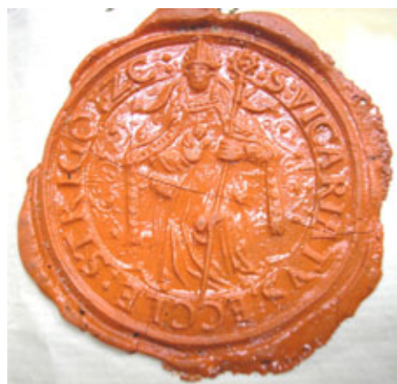
Obr. 34 Pečať vikariátu Ostrihomskej arcidiecézy

diecézy. 192 Inou možnosťou je, že postava v pečati vikára Jána zobrazuje samotného arcibiskupa, teda nadriadenú inštanciu, ktorú vikár zastupoval. 193