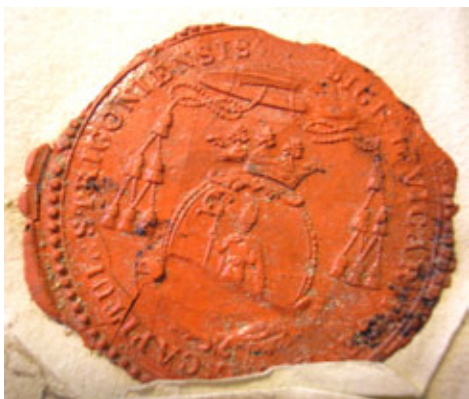
Obr. 40 Pečať ostrihomskeho vikára z roku 1834

onálnom erbe na úrovni generálneho vikariátu, ktorý je stereotypne zobrazovaný v pečatiach vikárov počas celého novoveku. Ide o zaujímavý prípad heraldizácie diecézneho patróna, ktorý by si určite zaslúžil hlbší výskum a komparáciu s pečatami ďalších uhorských diecéz. Táto problematika je o to zaujímavejšia, že doposiaľ heraldike na úrovni uhorskej cirkevnej inštitúcie nebola zo strany bádateľov venovaná takmer žiadna pozornosť. Nové poznatky z tejto oblasti by mohli priniesť dôležité informácie i pre súčasnú cirkevno-heraldickú tvorbu. Do budúcnosti nemožno vylúčiť existenciu ďalších pečatí, ktoré by mohli doplniť naše poznatky. Už boli spomenuté pečate stredovekých kanonikov. Rovnako nie je ešte dostatočne prebá-