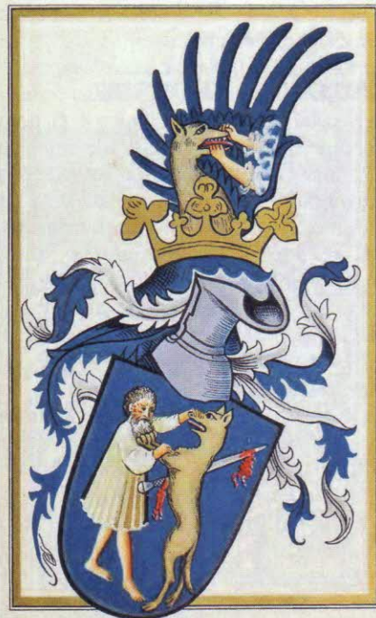
Rod z Malých Trakán

PR Akú úlohu zohrával erb v živote majiteľa?