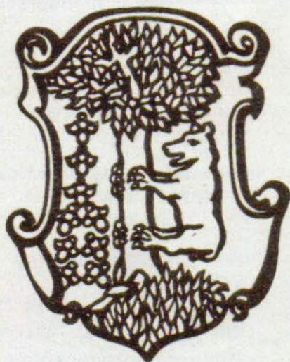
Erb Eliáša Medveckého

va na modrom štíte. Čiže porušili heraldické pravidlo, lebo dali farbu na farbu, ale v uhorskej heraldike to nie je nič nezvyčajné.