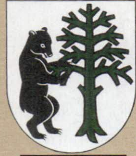
Oravský Biely Potok