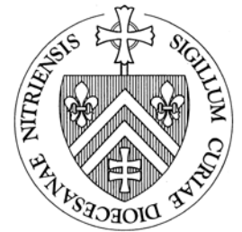
Pečiatka s prvým návrhom erbu Nitrianskej diecézy